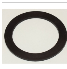
Dichtung f. Tankdeckel