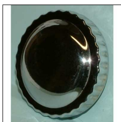
Tankdeckel, univers., mittel