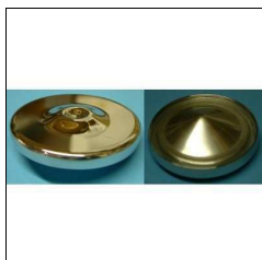
Tankdeckel 201 TS, 301 TS, 501/601 TS bis 34