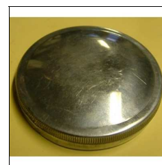
Tankdeckel, univers., groß