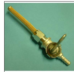
Benzinhahn Quickly Gewinde M 12 x 1,0 mit Dichtung