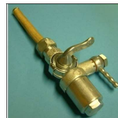
Benzinhahn NSU Max/Lux/Lambretta