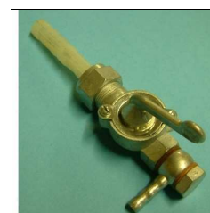
Benzinhahn ohne Filterbecher, 1 Abg. u. waagr