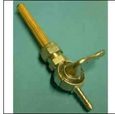
Benzinhahn NSU 251 OSL, Quick, Pony 100 u.a. Gewinde M 16 x 1,0 mit Dichtung