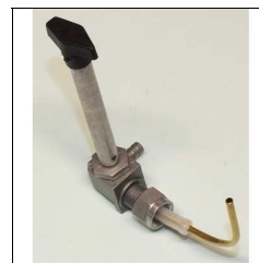
Benzinhahn Quickly T (Ersatz)