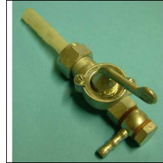
Benzinhahn ohne Filterbecher, 1 Abgang unten waagrecht mit Dichtung