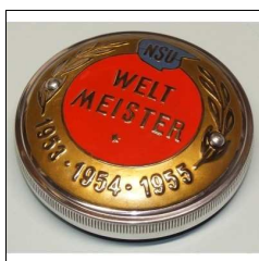
Tankdeckel Max mit WM- Plakette 53/54/55