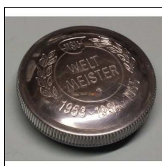
Tankdeckel NSU Quickly mit Weltmeister-Gravur