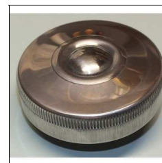
Tankdeckel Quick (Vorkr.mod.) u. Pony 100