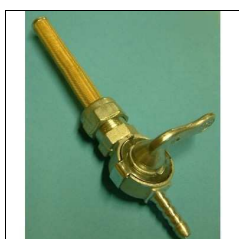
Kraftstoffhahn 251 OSL NK, Quick, Pony 100