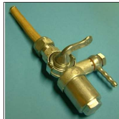
Benzinhahn (Becherfilter- Reservehahn) Max/Lux/Lambretta Gewinde M 16 x 1,0 mit Dichtung