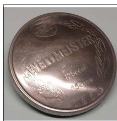
Tankdeckel Max mit Weltmeister-Gravur