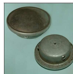
Tankverschlussdeckel Lambretta, Prima-D