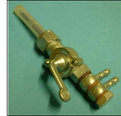
Benzinhahn ohne Filterbecher, 2 Abgänge unten waagrecht mit Dichtung