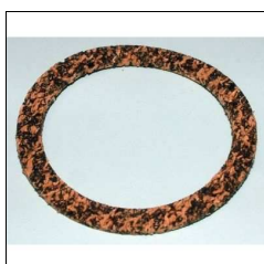
Dichtung f. Tankdeckel Lambretta, Prima-D