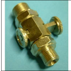
Benzinhahn 20er Jahre Blockmodelle 301 T, 501 T, 501/601 TS Gew. M 11 x 1,0 und M 13 x 1,0 501 T, 501/601 TS, 301 T, 301 TS u.v.a.mit Dichtung