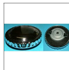
Tankdeckel NSU Quickly