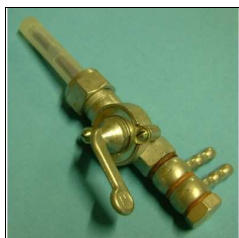
Benzinhahn 2 Abgänge unten