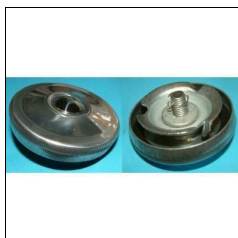
Tankdeckel f. Vorkr.modelle (OSL, Zweitakter)