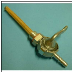
Benzinhahn Fox Außen- Gewinde M 14 x 1,5 mit Dichtung