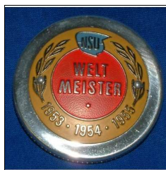
Tankdeckel Superfox, Maxi